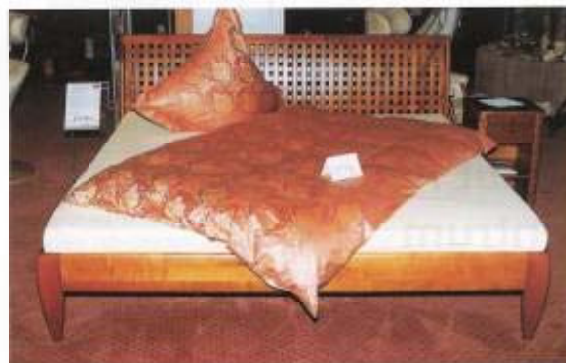
Optische Anziehungspunkte der umfangreichen Produktpräsentation sind sicherlich die komplett ausgestatteten Einzelbetten.

Hatten sie zuvor ein architektonisch gediegenes Ladenlokal im schräg gegenüber liegenden Anthroposophischen Zentrum angemietet, können sie jetzt auf rund 650 qm komplett ebenerdige Verkaufsfläche in einem ehemaligen, aufwändig modernisierten Edeka-Markt zurückgreifen. Das überaus harmonische und wohnliche Geschäftsinnere, das konsequent nach Feng Shui-Gesichtspunkten gestaltet wurde, lässt bei aller Großzügigkeit des Raumangebots keinerlei Rückschlüsse auf die ehemalige Nutzung zu.